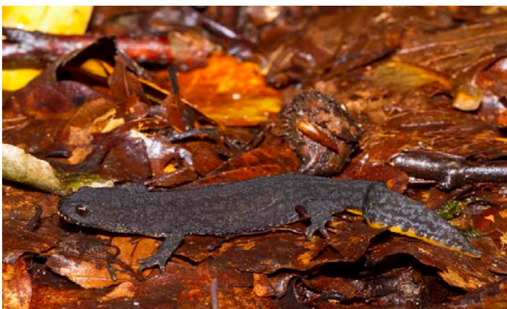
Figur 4. Voksen hun af Bjergsalamander på 100 mm totallængde. Den mangler en stærkt farvet rygstribe, som kun forekommer ved unger. Adult female Ichthyosaura alpestris with a total length of 100 mm. A bright vertebral stripe is absent in adult females.

Alt i alt finder jeg det mest sandsynligt, at populationen i Bernstorffsparken har sin oprindelse i Harzen.