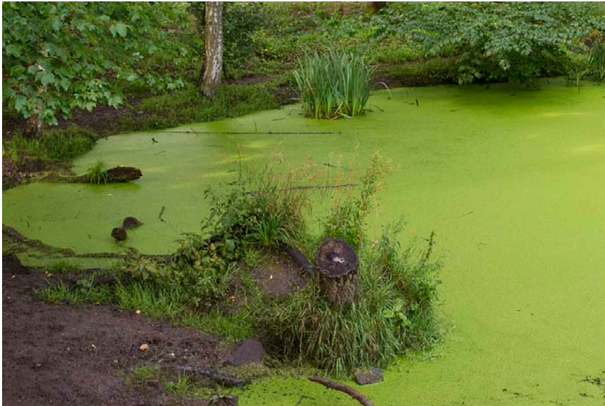
Figur 3. Sandsynligvis et vigtigt yngle-vandhul i Bernstorffsparken.

Probably an important breeding pond in Bernstorffsparken.