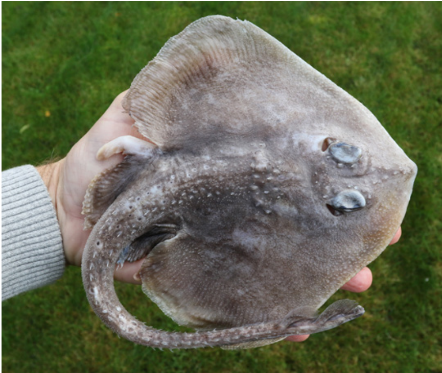
Figur 1. En 37 cm lang Fyllas rokke ( Rajella fyllae ) ZMUC P2397520 fra Skagerrak, 45 km nordvest for Grenen, Danmark.