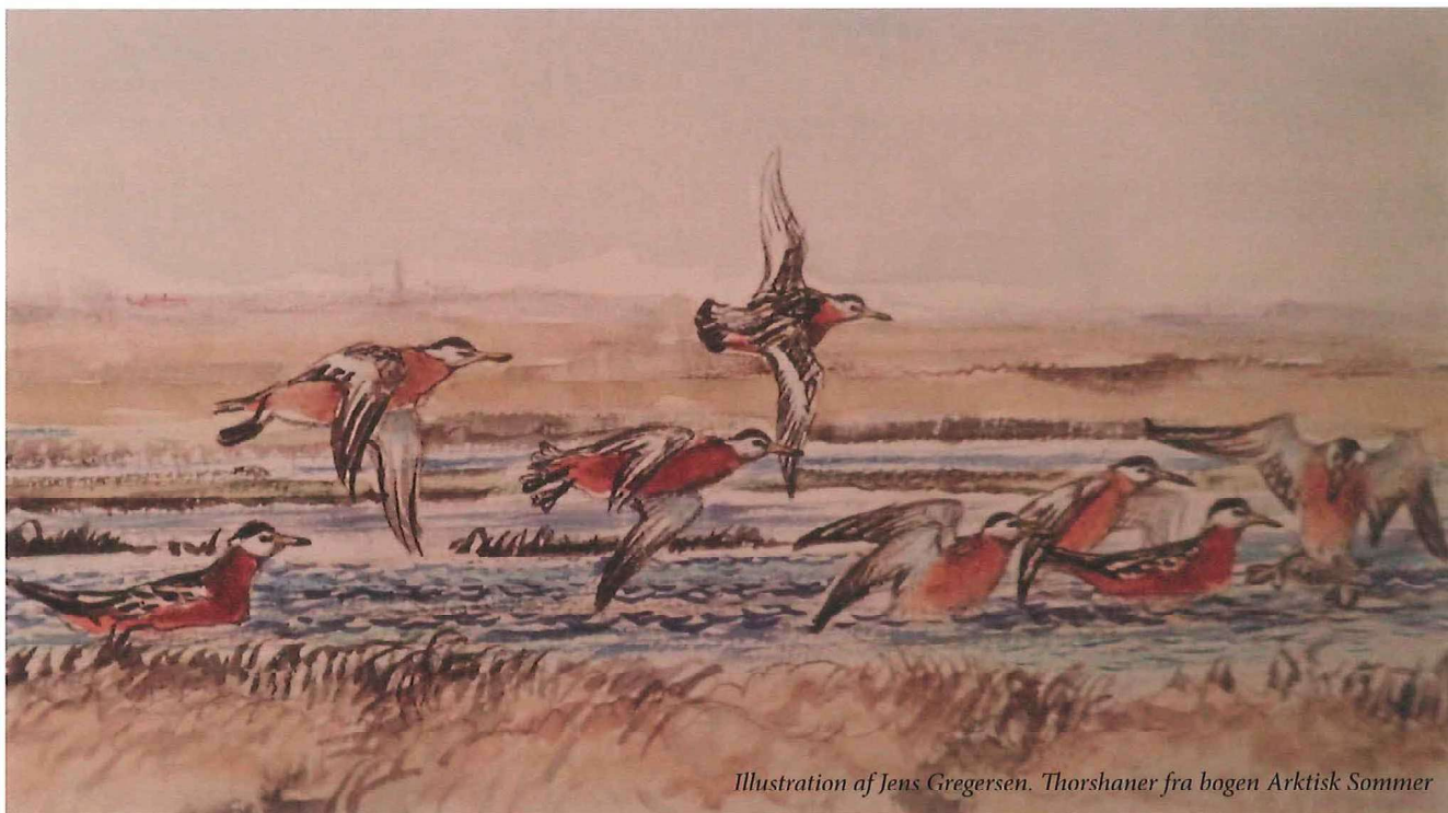
Illustration af Jens Gregersen. Thorshaner fra bogen Arktisk Sommer