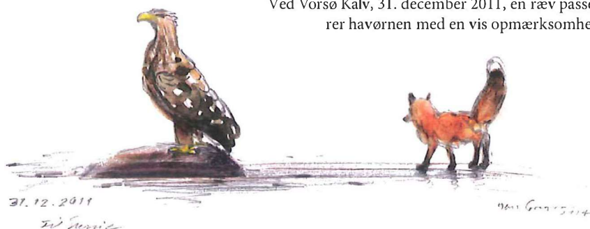
Ved Vorsø Kalv, 31. december 2011, en ræv passerer havørnen med en vis opmærksomhed