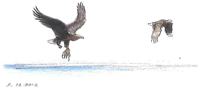
Øverst tv. Ørneparret i en bevoksning af døde birk på Vorsø kalv, 20. december 2013. Øverst th. Ørneparret har jaget dykænder mellem Vorsø og Alrø i Horsens Fjord. De bringer byttet, en ederfugl til Vorsø Kalv, hvor den ædes.

at slå sig ned i Danmark, men de fik aldrig nogen unger, hovedsageligt fordi de blev forstyrret.