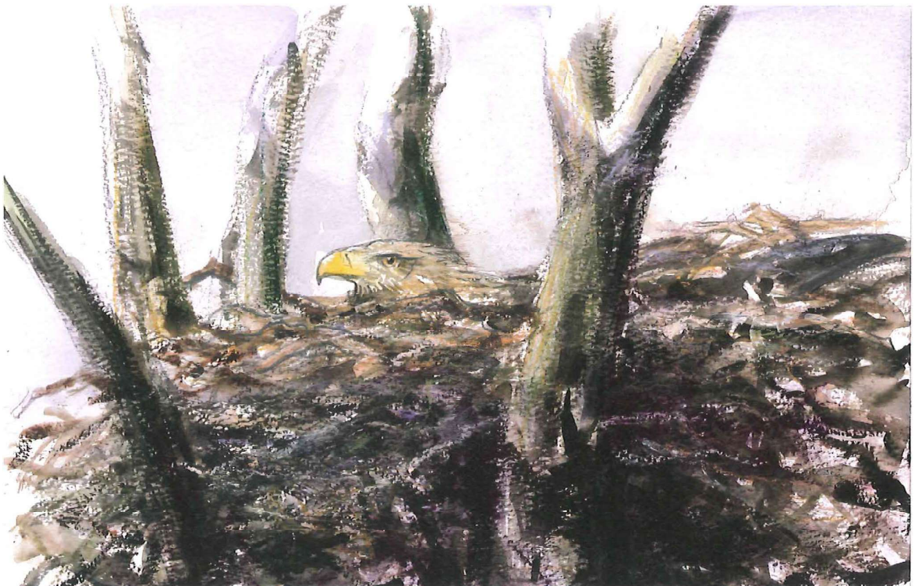
Den rugende han, 24. februar 2012. Reden blev bygget i løbet af december og januar, helt fra grunden, i en ask midt i Vorsø Vesterskov, omkring en lysning og åben korridor forårsaget af stormfald, hovedsageligt januar 2005.

Efterhånden brugte ungen mere og mere tid på at hoppe og danse i reden med ud-bredte vinger. Askeskoven sprang ud midt i maj, så det var sværere at se, hvad der forgik med ungen. I juni dækkede løvet for ungen, men af og til kunne den ses oppe