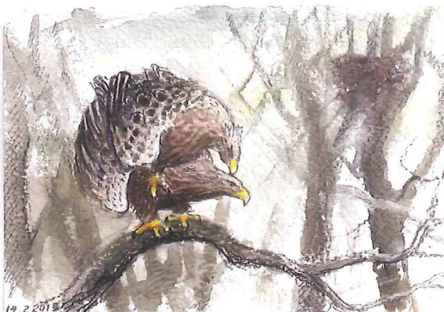
Nederst tv. Parring nær reden, 14. februar 2013. Nederst th. Hunnen og ungen, 5. juni 2013.

I løbet af maj havde ungen fjerdragt, og vingerne var vokset til rigtige vinger.