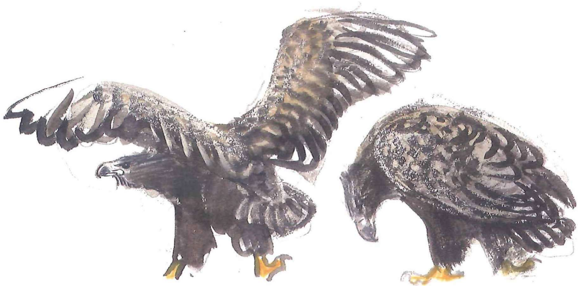
Ørneungen 23. maj 2013 i en alder af 53 dage. Den over vinger og er meget synlig i reden.