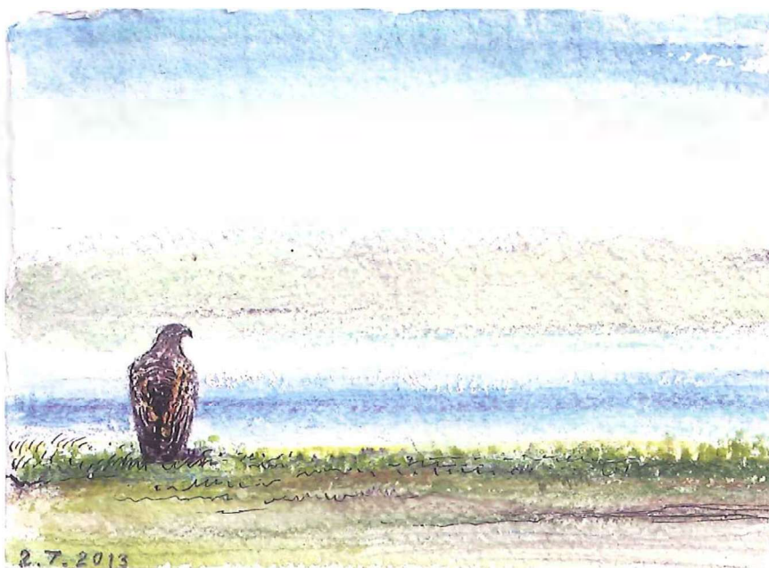
Ørneungen 2. juli 2013 på strandengen Kalvøerne, sydvest for Vorsø. Den har endnu ikke været ude på længere flyveture.