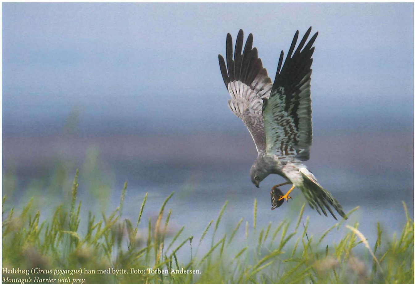
Hede­høg ( Circus pygargus ) han med bytte. Montagu's Harrier with prey.

The number of breeding pairs of Montagu's Harrier in Southwest Jutland in 1995-2013 (no data from 1999 nor 2003). The population decline is significant ( R^2=0.456 , p<0.01 , n=17 ). (blue columns = confirmed/probable breeding pairs, white columns = possible) and number of fledged young 2000-2013 (red line).