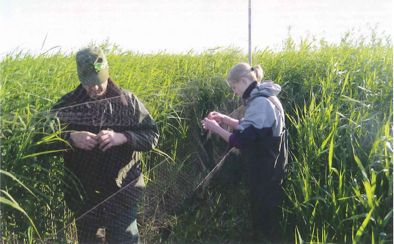
Rørspurv ( Emberiza schoeniclus ) Juli 2009 (Øv. tv. top left), Sivsanger ( Acrocephalus schoenobaenus ) Juni 2010 (Th. right hand side). Rørspurv juni 2010 (Midt.tv. in the middle). Ringmærkere i gang med at tage fugle ud af nettet ved Brabrand Sø, juni 2010 (Nederst, bottom): Ringers started taking birds out of the net at Lake Brabrand, June 2010.