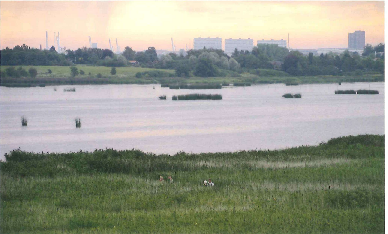
Rørsanger ad. ringmærket 20. juni 2010 (Øv. tv, top left). Skægmejse ( Panurus biarmicus ) ad. han og hun fanget og ringmærket 1. juli 2009 (Øv.th, top right). Græshoppesanger ( Locustella naevia ) maj 2009 (Midt.tv., Middle. left). Rødstjert ( Phoenicurus phoenicurus ) august 2009 (Midt th., Middle right). Overblik over området, hvor der ringmærkes ved Brabrand Sø (Nederst, bottom) Fotos: Henning Ettrup. Ringers started taking birds out of the net at Lake Brabrand, June 2010.. Fotos: Henning Ettrup. Overview of the area where ringing takes place at lake Brabrand.