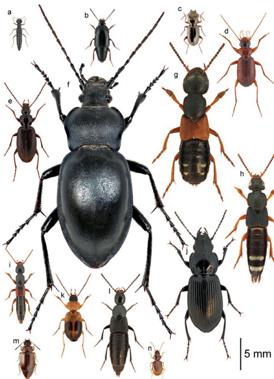
Figur 1. Typiske eksempler på danske rov- og løbebiller fanget i dette studie. Løbebillerne kan kendes på deres lange umodificerede løbeben og en indsnævring i forbenet som de bruger til at rense deres antenne med. Rovbillerne kan nemt genkendes på deres forkortede dækvinger. a) Stenus clavicornis , b) Tachinus rufipes , c) Notiophilus rufipes , d) Leistus terminatus , e) Platynus livens , f) Carabus glabratus , g) Staphylinus erythropterus , h) Platydacus fulvipes , i) Lathrobium castaneipenne , j) Pterostichus melanarius , k) Badister laceratosus , l) Philonthus decorus , m) Anthobium atrocephalum , n) Trechus secalis . Typical examples of Danish rove- and ground beetles registered in this study. Ground beetles can be identified by the long un-modified legs and the depressing in the front legs, which they use to rinse the antennae. Rove beetles have short wing cover. Species names are listed above.